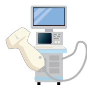
現在使用のエコー